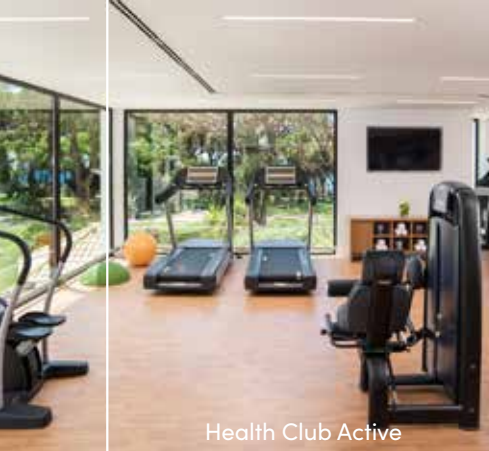
Health Club Active