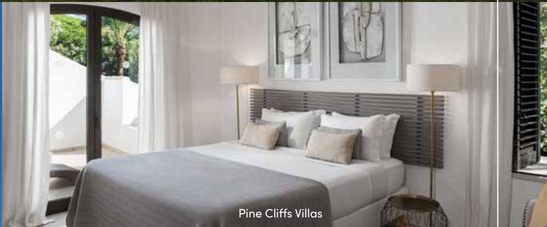
Pine Cliffs Villas