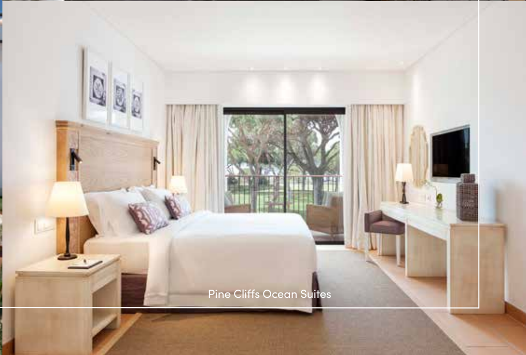
Pine Cliffs Ocean Suites