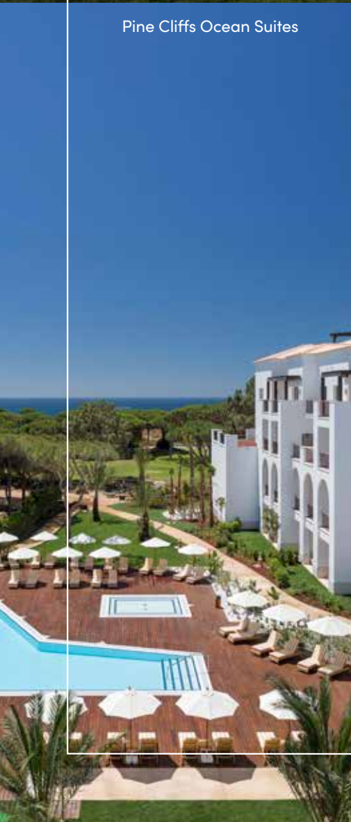
Pine Cliffs Ocean Suites