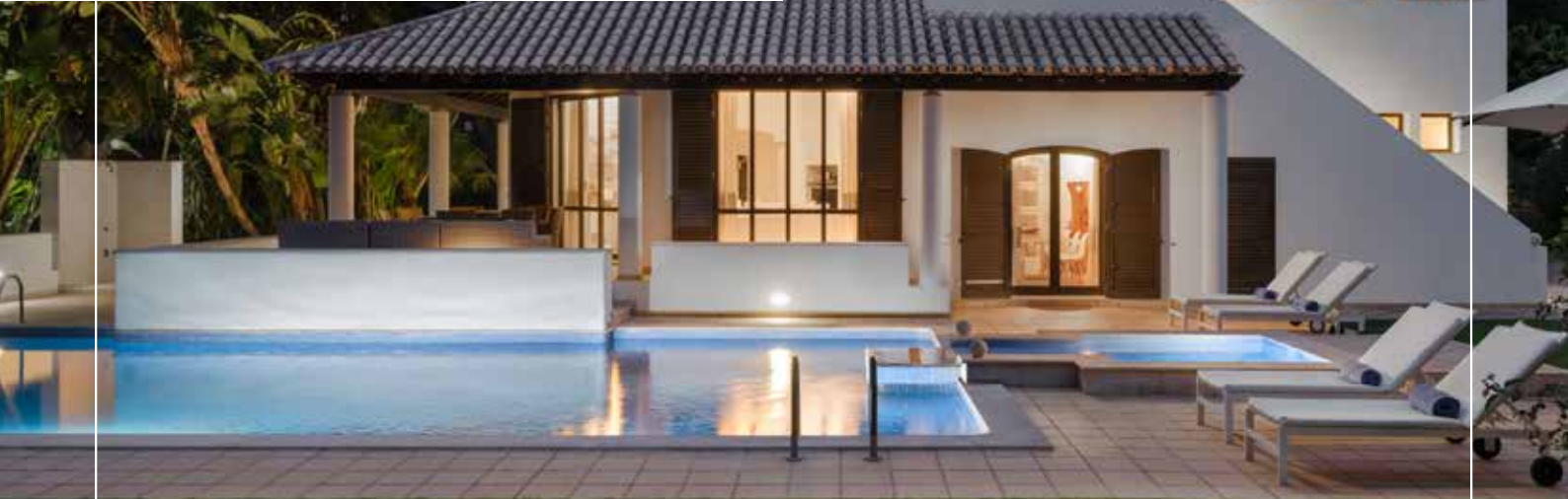
Pine Cliffs Villas

Whether you choose to stay in an apartment or a private villa, safety and tranquility are guaranteed.